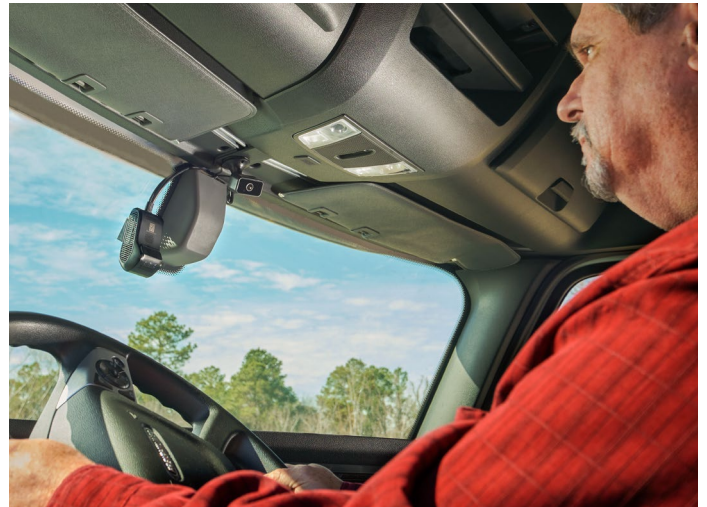
El IC 500 con cámara periférica hacia el conductor en una instalación típica de montaje en parabrisas.

Si bien nos esforzamos por garantizar la precisión de todas nuestras especificaciones publicadas, el rendimiento de campo real puede variar según una variedad de factores ambientales, de instalación y de uso, así como factores de terceros, como proveedores de servicios celulares. Las especificaciones enumeradas son aproximaciones, y no constituyen declaraciones vinculantes ni modifican los términos y condiciones de compra o alquiler, incluidas las limitaciones y garantías operativas del producto. Todas las especificaciones están sujetas a cambios sin previo aviso. Visite www.orbcomm.com para asegurarse de tener la última versión de estas especificaciones.